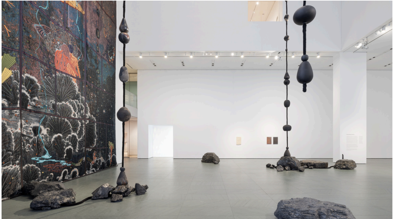
Installation view of the exhibition "Otobong Nkanga: Cadence" October 10, 2024–June 8, 2025. IN2574.7.