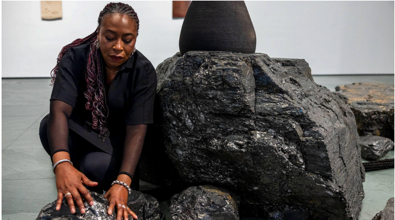
Otobong Nkanga during installation of the exhibition “Otobong Nkanga: Cadence [MoMA Exh. #2574. October 10, 2024–June 8, 2025] The Museum of Modern Art Archives, New York. Photography by Jonathan Dorado