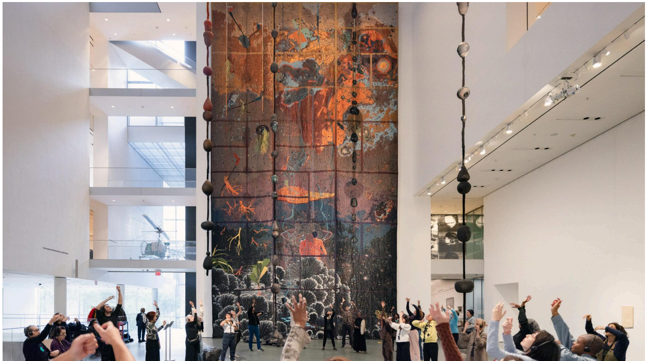
©2024 The Museum of Modern Art, New York. Photo: On White Wall